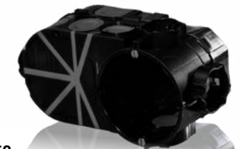
E550 No. d'art. 7320009