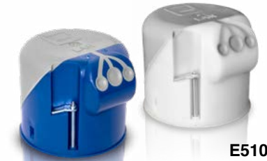
E5100 No. d'art. 7360051